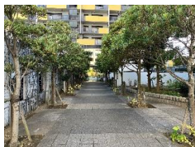
アバンセの特徴でもある グリーンアプローチ