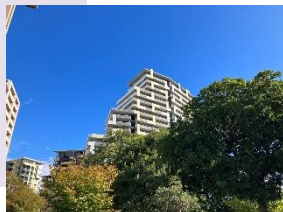
公園の樹々で季節の 移り変わりを感じられます