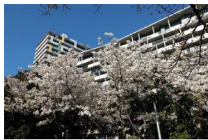
バルコニーからの眺望 春には満開の桜が見られます