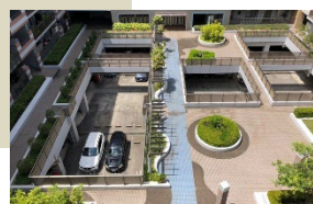
中庭向きのお部屋は 静かなのがgood!