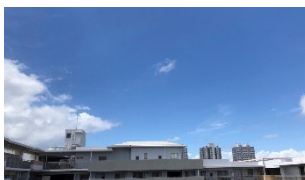
バルコニーから広がる青空