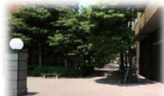
新緑のケヤキ並木道の入口