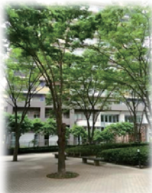
ベイタウンを象徴する建物のひとつ 並木道がとてもおしゃれ