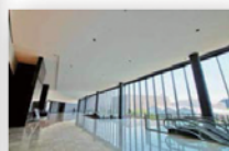
ホテルのようなメインロビー